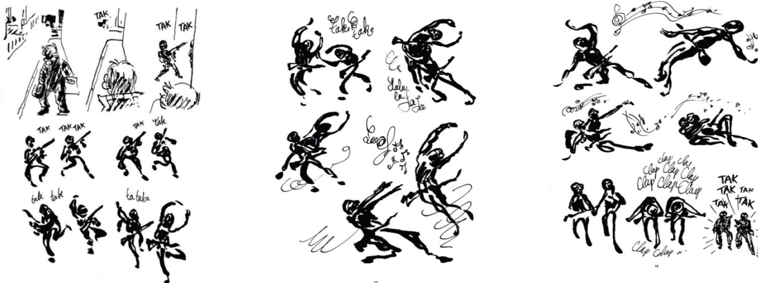
Le chapitre de « Tak, Tak, Tak ! » 52

Il est important de noter le placement de ce chapitre dans la structure du livre. Cette scène est précédée d'un chapitre d'amour ; celui qui s'ensuit, intitulé « Ginette », raconte l'histoire de sa 'boule au ventre' – qui fait partie du personnage de Luz, de son corps, dès qu'il s'est aperçu les assassins. Luz montre le rapport de l'amour à la terreur, dans son livre et dans sa vie. En même temps, lorsqu'il représente les tueurs comme des danseurs, leur donnant un sens de beauté, il rend les différences entre le Bien et le Mal plus ambiguës.