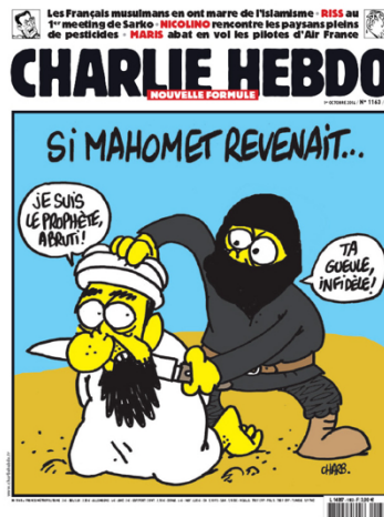
La couverture du numéro 1163 7

couverture qui s'intitule « Si Mahomet revenait... ». Ce dessin représente un guerrier de Daesh en train de couper la gorge du prophète Mahomet en disant « Je suis le Prophète, abruti ! » à un membre de Daesh, qui répond, « ta gueule, infidèle ! ». 6 Le choix de cette image d'une violence radicale exprime le droit de tout dire, y compris au sujet de la religion musulmane.