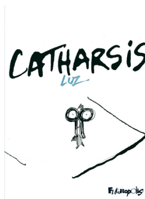
Couverture de Catharsis 51

Le choix du titre Catharsis est très important 49 : le terme se trouve, à l'origine, dans la Poétique d'Aristote. Il définit la catharsis, l'effet même de la tragédie, comme la purgation des émotions de la crainte et de la pitié-après une tragédie. Les conséquences affectives suite à un tel traumatisme sont toujours pénibles. 50 Le livre Catharsis est la preuve-même de la catharsis que vit Luz : il semble être une étape essentielle de sa remise en forme après les attentats.