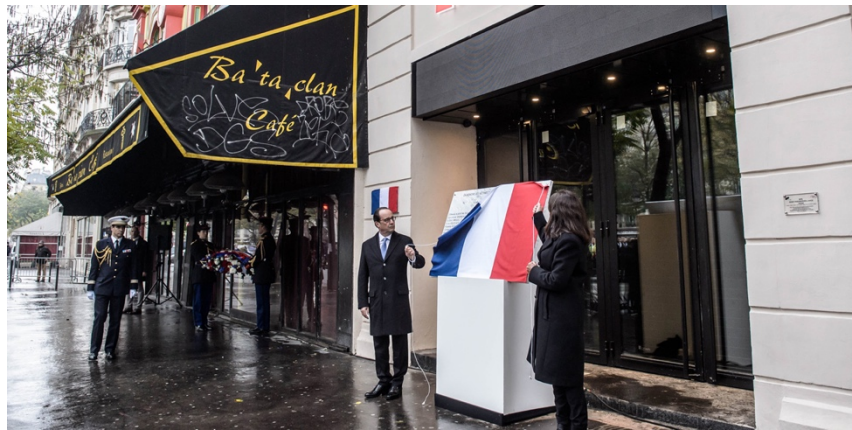
François Hollande et Anne Hidalgo, membre du Parti socialiste en France : dévoilement de la plaque commémorative au Bataclan 67

Manuel Valls, ont assisté aux commémorations, ainsi que des citoyens, tous ce qui ont été touchés par les attentats. Ils ont observé une minute de silence dans chaque lieu, et une gerbe a été déposée. 66 En effet, dans l'ensemble, cette cérémonie comprend dans l'ensemble un exemple de l'art public, voire institutionnel créé sous l'égide du gouvernement. Les plaques sont aussi un signe public d'affirmer l'unité nationale, preuve même d'un engagement politique.