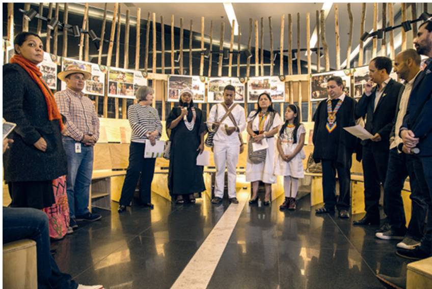
Figura 1. Presidenta y magistrados indígenas de la JEP en el lanzamiento de la exposición “Cuenten con Nosotros para la Paz, Nunca para la Guerra”.