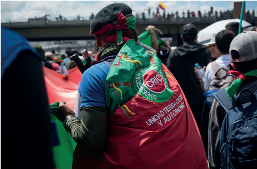
Obra: Guardia de la vida Autor: Erika Hernández