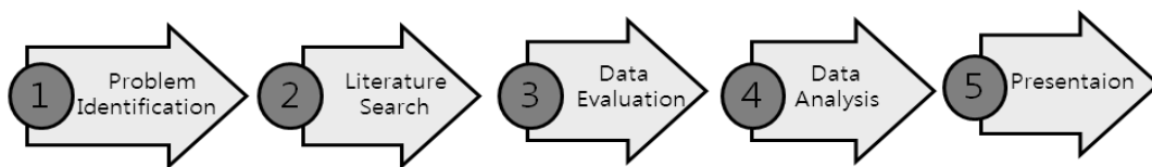
<Figure 1> Process of integrative review.